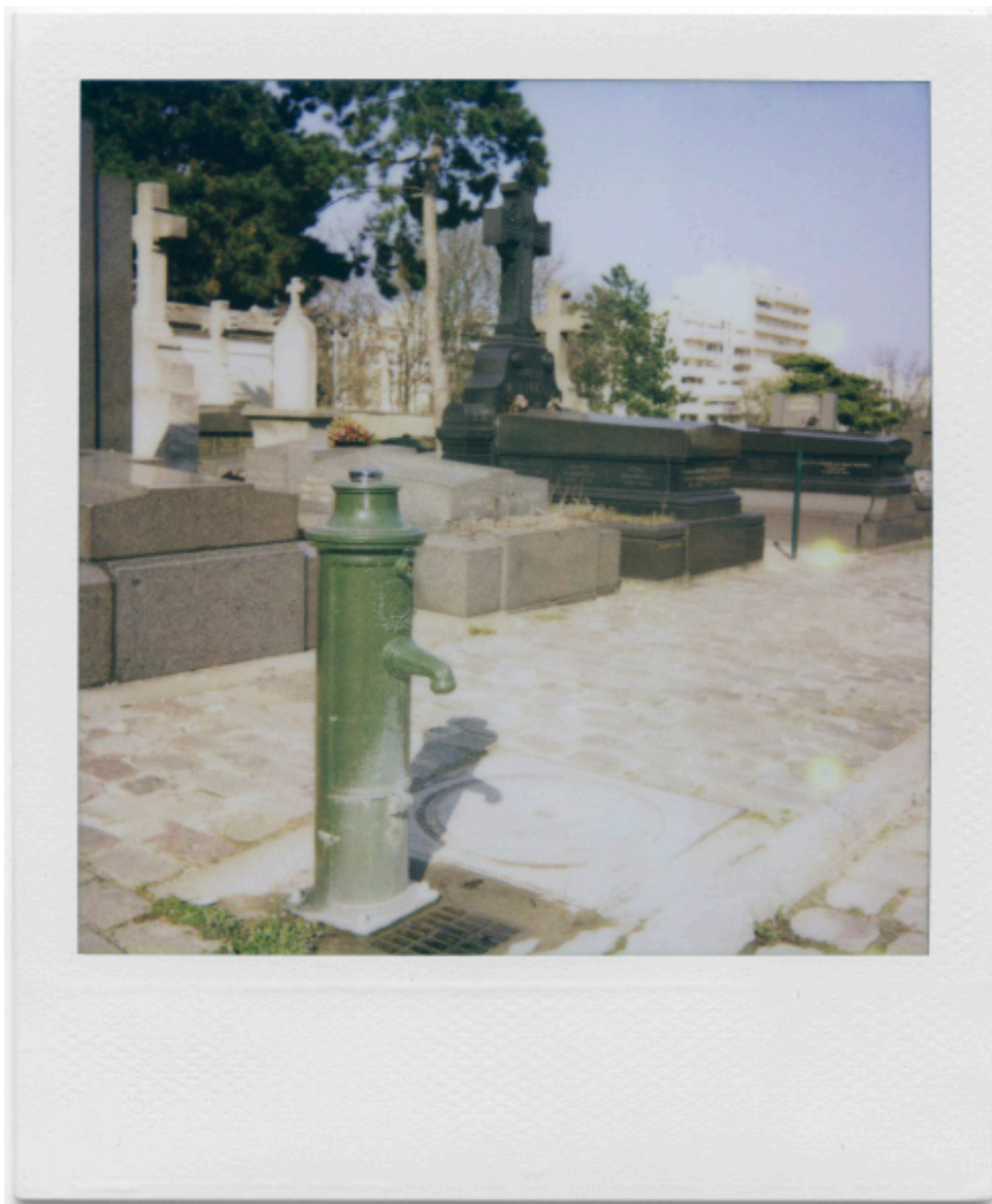
L'eau de Paris affiche 140x120cm

Exposition du 10 décembre au 14 janvier 2012