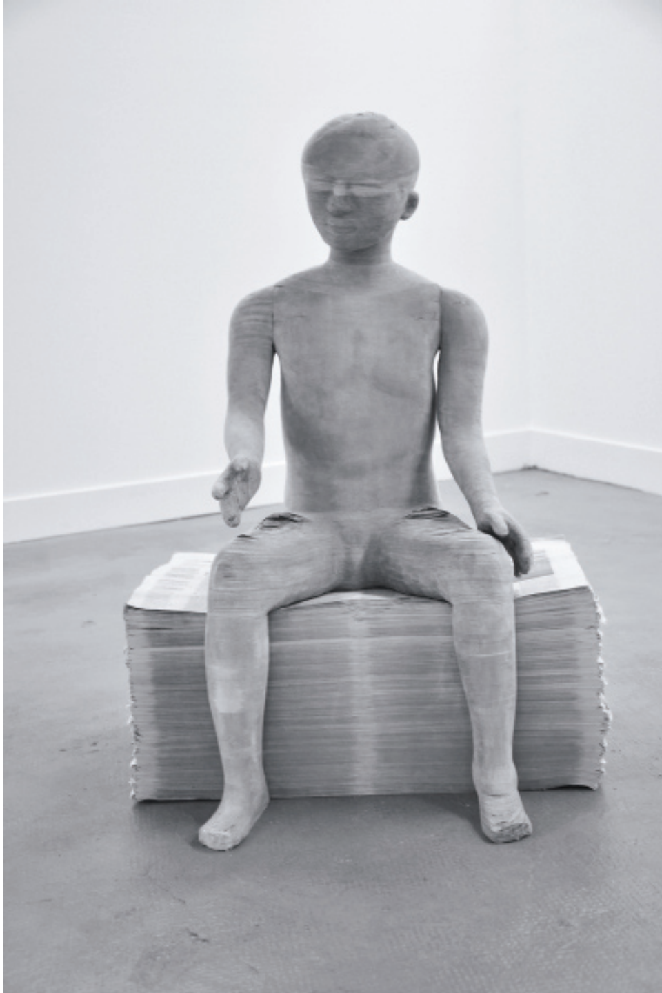
_Jeune garçon_ 2009 échelle 1/1 papier journal, structure métallique

Exposition du 10 décembre au 14 janvier 2012